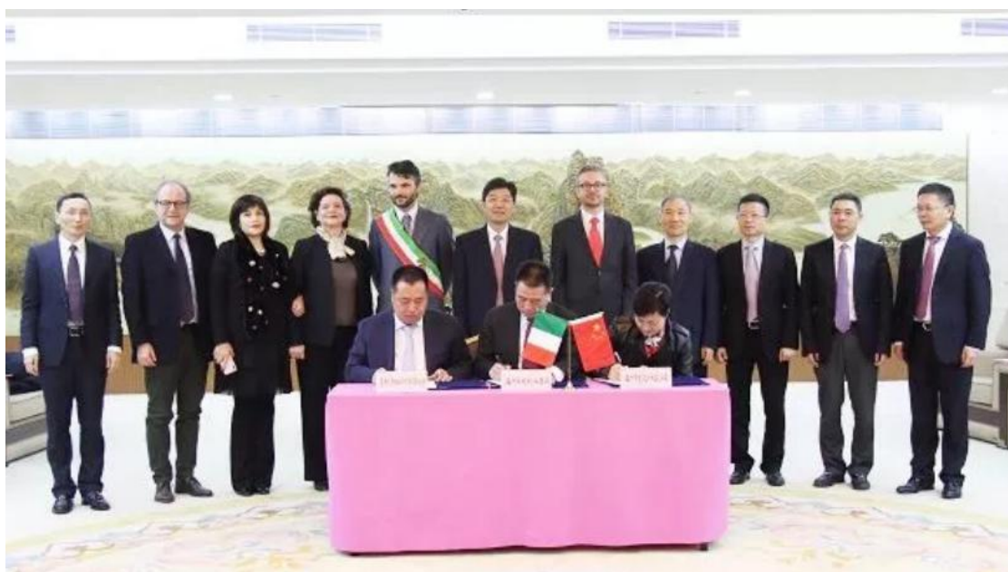
签署普拉托“都市书房”合作建设协议

始建于2014年的城市书房，是温州深化文化体制改革的一大创举。本月初，在市文化广电旅游局、温州日报报业集团欧华联合时报、意大利普拉托华人华侨联谊会三方联合推动下，第一家城市书房海外版“都市书房”正式落户普拉托。书房目前处于装修阶段，装修完毕后将由市图书馆提供主题为中国历史文化和温州风土人情为主的图书万余册、期刊若干种。